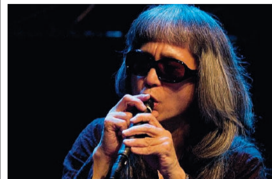
Nel 2007 al Moers Festival

Haino sarà a Venezia alla prossima Biennale Musica con una delle sue speciali esibizioni dal vivo in prima mondiale, e con la presentazione del documentario sulla sua carriera diretto da Kazuhiro Shirao, una prima assoluta al di fuori del Giappone. ATS/RED